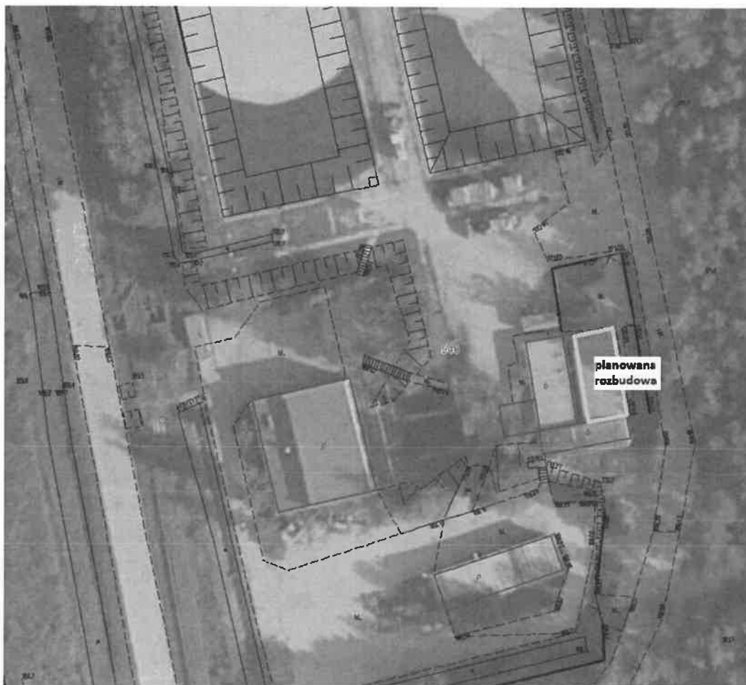
Rys. 1 Lokalizacja inwestycji

2. Zakres inwestycji polega na zaprojektowaniu i wykonaniu, rozbudowy bazy obsługi składowiska „Pióry”.